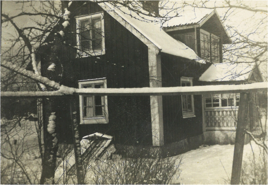
Björkeberg i vinterskrud. Okänd fotograf och okänt årtal (O 220 F1A:4)

så småningom att flytta tillbaka till honom och utgöra en självklar del av den växande syskonskaran.